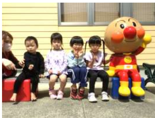
4月生まれのお友達