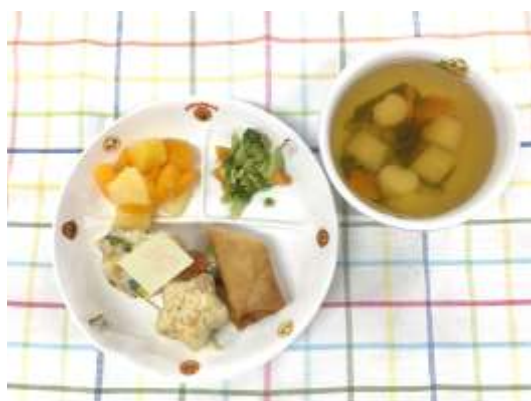
たけのこご飯プレート