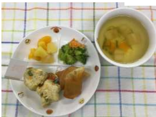
たけのご飯プレート