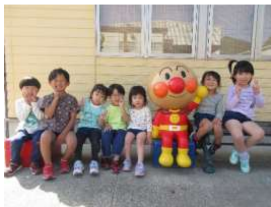
4月生まれのお友達