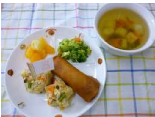
たけのこご飯プレート