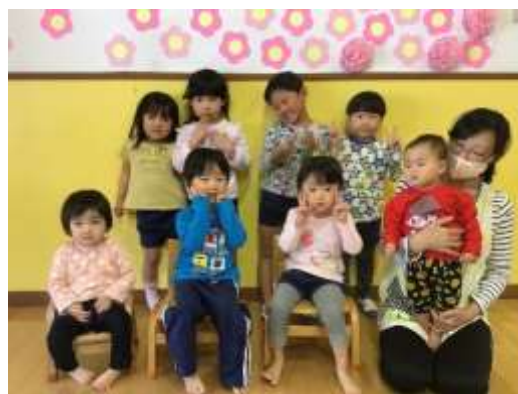
4月生まれのお友達