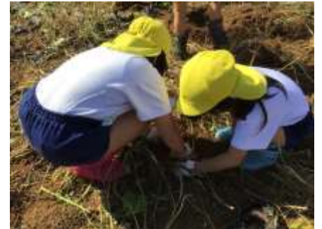
よいしょ！よいしょ！