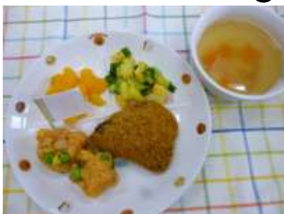
ハロウィンランチ