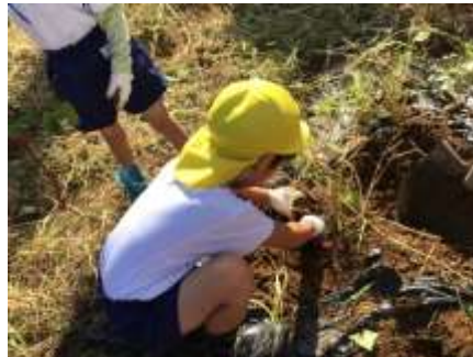
カいっばいひっぱりました