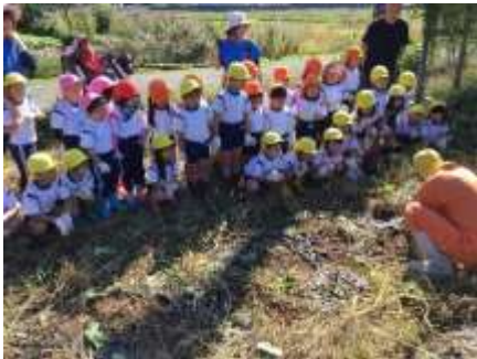
掘り方を教えてもらいました

みんなで植えた苗からたくさんのさつまいもができてしていると聞き、とてもわくわくしていました。土を手で掘ったり、つるを引っばったりするとさつまいもが出てきて子どもたちは大興奮でした。