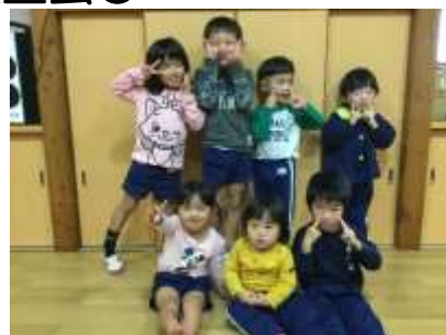
10月生まれのお友だち