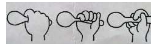
上手持ち 下手持ち 鉛筆持ち

★給食時は、スプーンを使っています。スプーンの持ち方は、お箸への移行、鉛筆の持ち方へと繋がってきますので、正しい持ち方が身に付くように声をかけています。ご家庭でもえんぴつ持ちができるように、声をかけて頂けると有難いです。