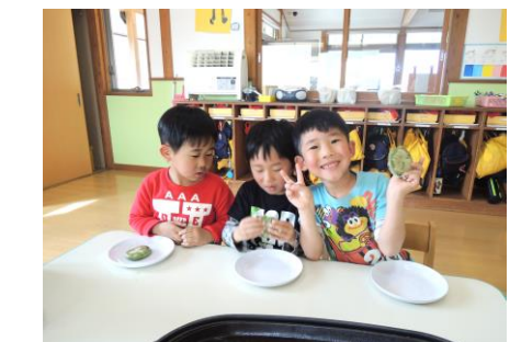
みんなで食べました