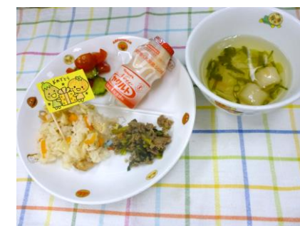
たけのこごはんランチ