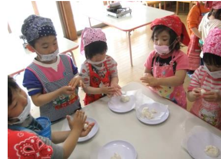
丸めているところ

お釈迦さまの誕生を祝って、団子を作りました。ぱんだ組になり初めてのクッキングという事で楽しんで作っていました。団子を丸めたり、おたまでお鍋の中に入れて茹でたり様々な体験が出来ました。出来上がったお団子はきな粉をかけて食べました。おいしいと大喜びの子どもたちでした。