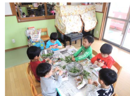
よもぎの下ごしらえ

身近な草を食材に選ぶことで、収穫、下ごしらえから携わることが出来、より食材への理解が深まりました。成形は少し難しかったですが、中のあんこがはみ出しているにもかかわらず、とてもおいしく仕上がりました。