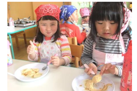
みんなで食べました