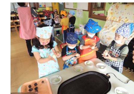
丸めているところ