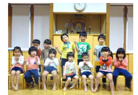
4月生まれのおともだち