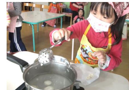
茹でているところ