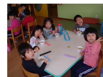
みんなで食べました