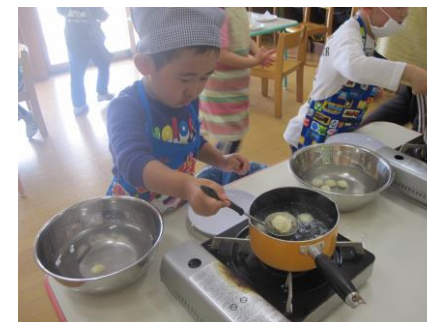
ゆでているところ