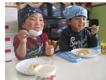
みんなで食べました