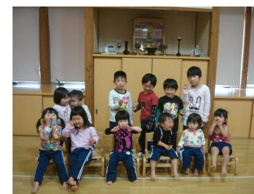
4月生まれのおともだち