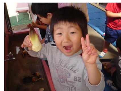
筍を洗っているところ

○筍掘り○ 地面から少しだけ顔を出している筍を見つけ、手で掘ったり、理事長先生に掘ってもらったりしました。あと少しで取れるという所まで掘ってもらい、みんなで収穫。大興奮で楽しみました。 ○筍ご飯作り○ 筍を洗い、皮むき、あく抜きと、下処理から行いました。今回初めて包丁も使いましたが、手際のいい子が多く驚きました。出来上がったご飯はたくさんおかわりして食べました。