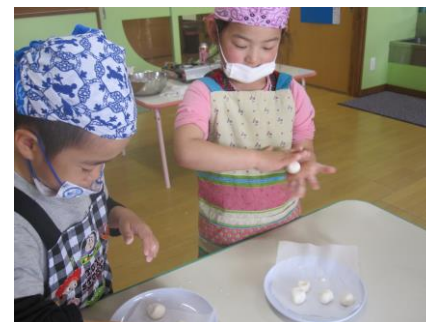
手で丸めているところ

お釈迦さまの誕生を祝って、団子を作りました。丸めた団子をお玉でお鍋の中に入れて茹で、ツルンとしたお団子が完成しました。出来上がったお団子はきな粉をかけて食べました。茹でる時には、慣れた手つきでお玉を扱う子どもたちに驚かされました。