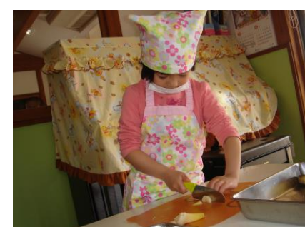
筍を切っているところ